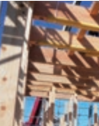
柱の柱、米松の梁、これぞ適材適所の骨太構造！