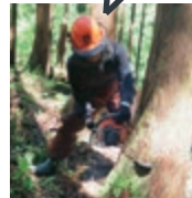
木材を知り尽くすための林業体験！