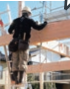
この梁がお家をしっかりと支え続けます！

昨年の中部地震で被災された方に心からお見舞い申し上げます。ウェリーハウスの現在の耐震基準は、性能表示制度で最高レベルの耐震等級3同等。一般的に木造の耐震施工基準として、地震の揺れに面(耐力壁)で抵抗する考え方が重視・注力される中、その基盤となる骨組み、いわゆる2階や屋根を支える梁(横材)やそれらを支える柱(縦材)の材質(樹種)や径(太さ)は重要視されない、または『違いがよくわからない』との理由で見落とされる方が多いと感じます。実はこの骨組みも最も重要な要素の一つで、設計段階で梁の組み方を一歩間違えると抜け落ちる！さらには径が細いあるいは、樹種が軟弱だと荷重に耐えられず1階の建具が開かなくなり経年劣化で建物にひずみが起きて耐震バランスが崩れるなど危険性も高まります。耐久性においても土台・柱にシロアリの大好物の樹種は禁物です。完成では見えなくなる構造又は仕様・設計の違いにより、この度の地震で明らかな差が出たのではないのでしょうか・・・骨組みも構造見学会で必ず一度はご確認されることをおすすめします！